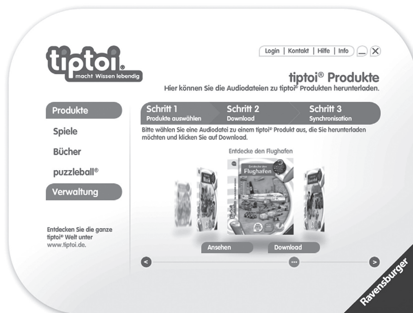
Ansicht „Produkte“ im tiptoi-Manager

Ertönt die Meldung „Bitte lade zuerst die Audiodatei für dieses Produkt auf den Stift“, gehen Sie bitte vor, wie im Abschnitt „tiptoi-Manager“ beschrieben.